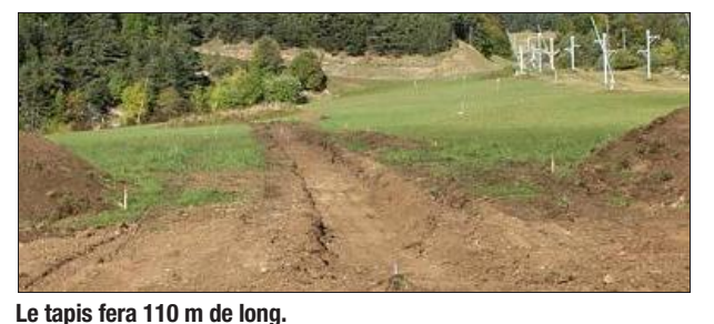
Le tapis fera 110 m de long.

Depuis lundi dernier, la Régie des remontées mécaniques (RRM) a entrepris la construction d'un tapis neige d'apprentissage roulant, adapté aux personnes à mobilité réduite. Le tapis sera long de 110 m, implanté sur les pistes du Bessard. Les 130 000 euros HT sont financés en partie par la