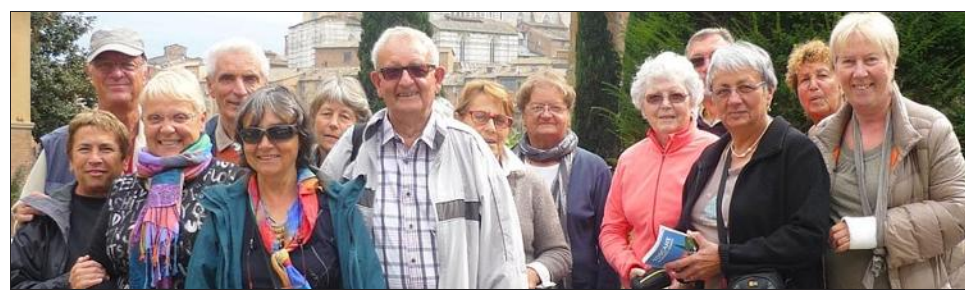
Le périple les a notamment menés à Lucca.

Ce mardi, une vingtaine d'adhérents de l'Amicale des sources de la Gresse est revenue d'Italie. Une vingtaine de membres de la classe 62 (nés en 1941) de Vif s'était jointe à ce périple.