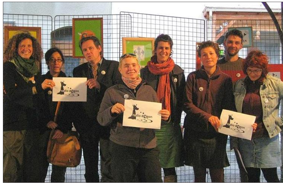
Une partie des membres actifs a présenté sous la halle le logo choisi pour Radio Dragon.

Mercredi, un goûter "en stéréo" a été organisé sous la halle par les membres de Radio Dragon (anciennement "Ami-e-s de RMA"). La trentaine d'actifs de l'association souhaitait par cette action faire découvrir aux personnes résidant en Trièves, Matheysine, Beaumont et Valbonnais les émissions déjà réalisées par les bénévoles et le nouveau logo choisi pour la radio.